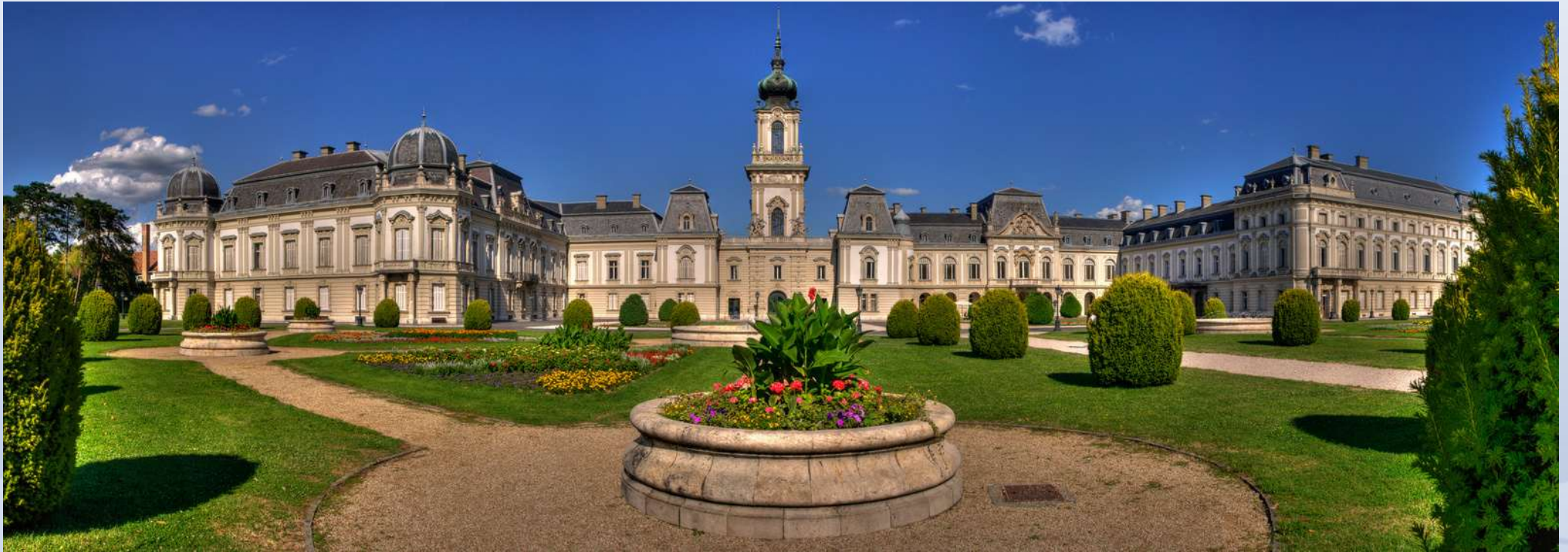
Keszthelyi Festetics-kastély és kastélypark