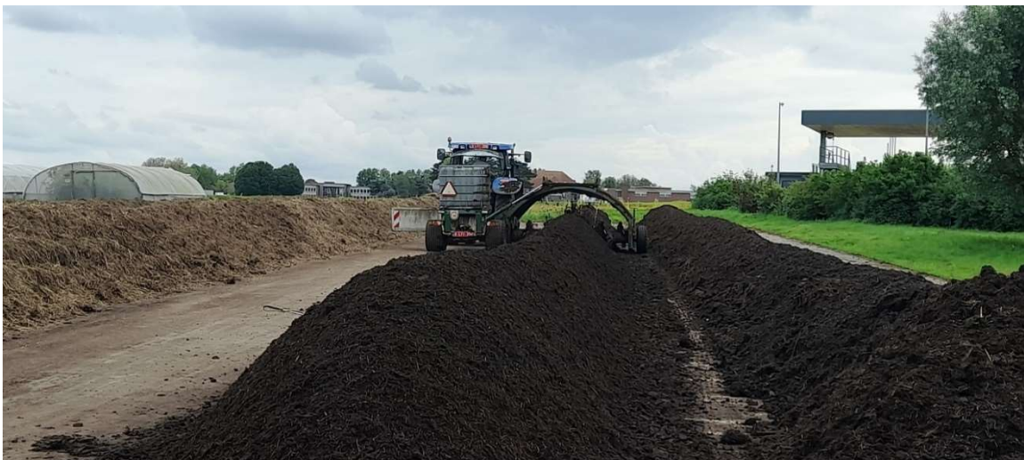
Az ILVO Mezőgazdasági, Halászati és Élelmiszeripari Kutatóintézet ( Institute for Agricultural, Fisheries and Food Research ) komposztáló telepe Merelbekében