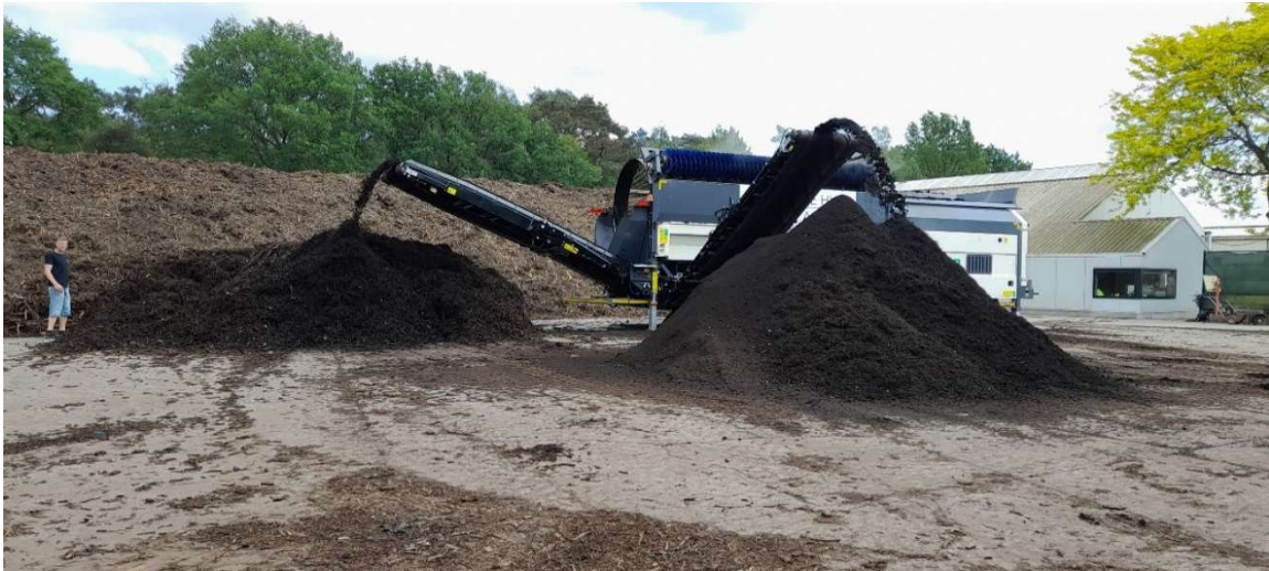
Városi komposztáló telep Sint-Niklaasban

2024. május 14-16, Mechelen (Flandria, Belgium):