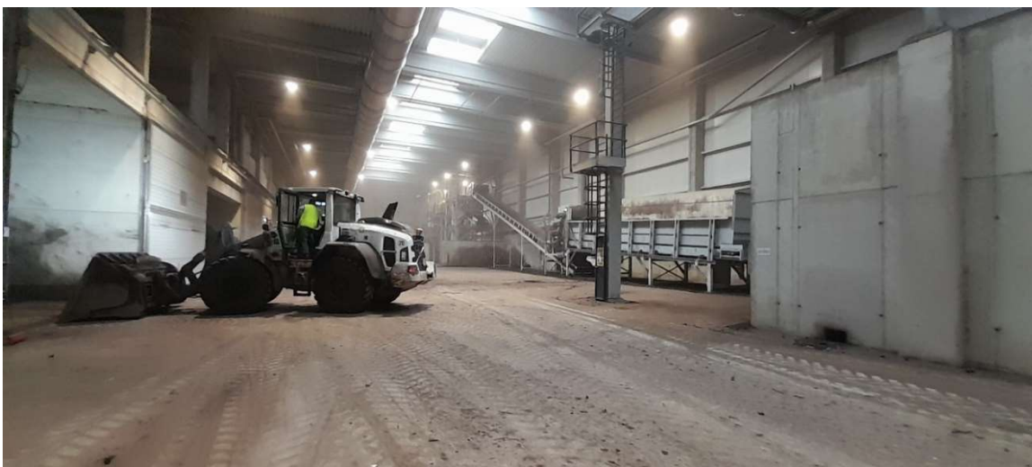
Reterra komposztáló üzem Trappenfeldében