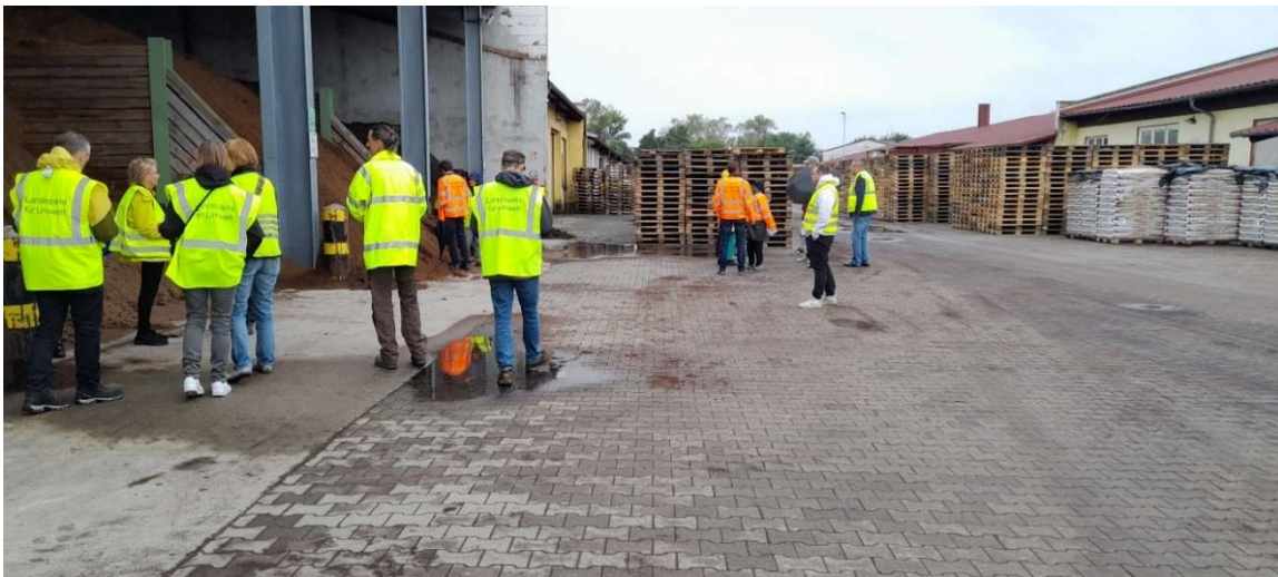
Störk GmbH komposztáló telep Nauenben