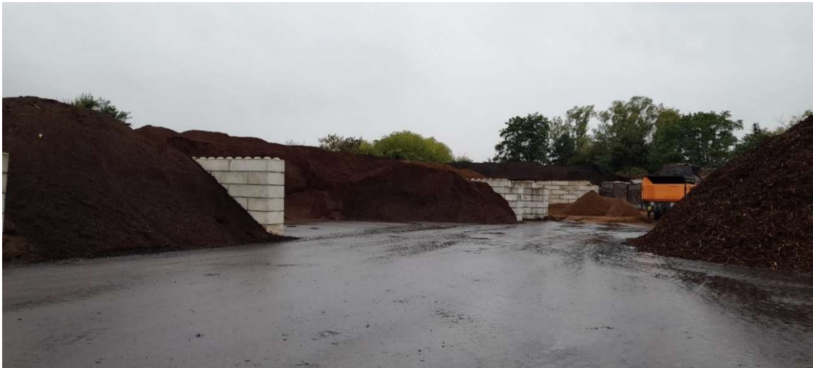
Störk GmbH komposztáló telep Nauenben