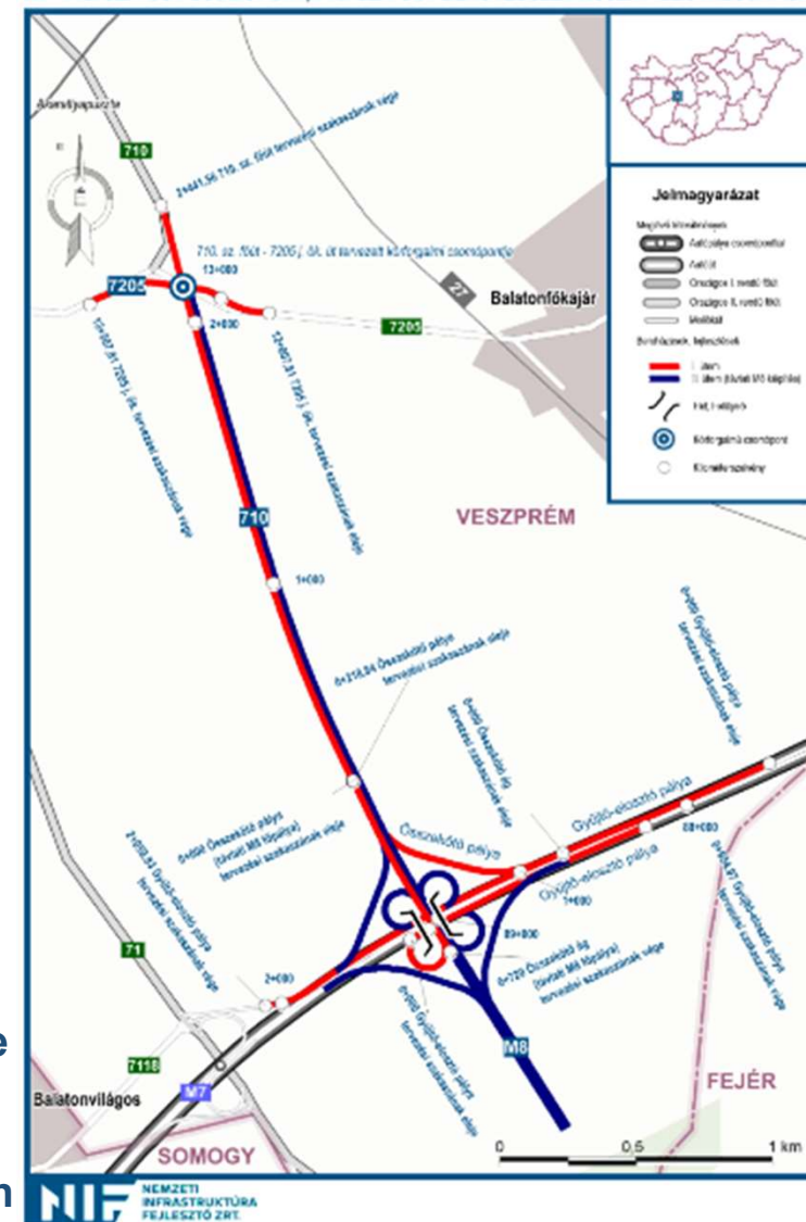
M7 - 710. SZ. FŐÚT CSOMÓPONT, 710. SZ. FŐÚT BEKÖTÉSSEL PROJEKT MEGVALÓSÍTÁSA