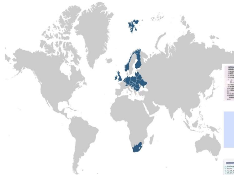
Map of the countries applying Resolution No. 40